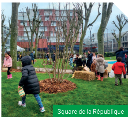
Square de la République

Convaincus qu'une ville doit offrir des espaces de détente et de verdure, nous avons agi pour rendre Bezons plus verte, avec un meilleur cadre de vie pour nos habitants.