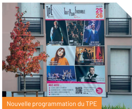
Nouvelle programmation du TPE

✓ Théâtre Paul-Éluard (TPE) : nouvelle programmation