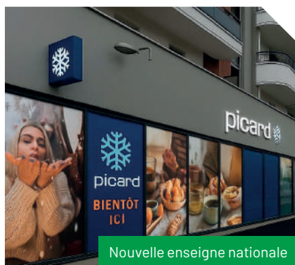
Nouvelle enseigne nationale