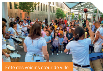
Fête des voisins cœur de ville

✓ Saison événementielle pour tous, Bezons Fête l'été et l'hiver, Chasse aux Œufs, Halloween