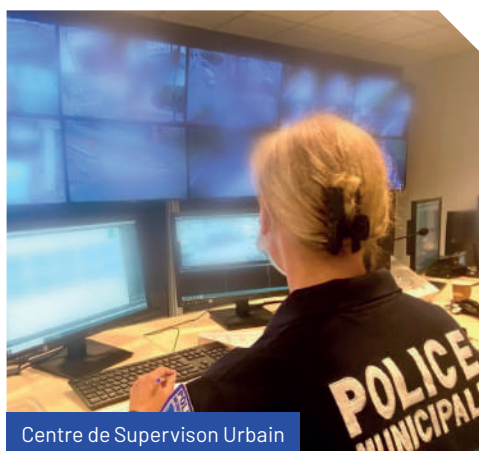
Centre de Supervision Urbain