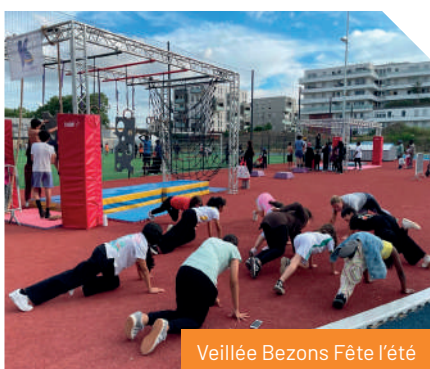
Veillée Bezons Fête l'été

✓ Création de la Maison de la Jeunesse en cœur de ville en 2025