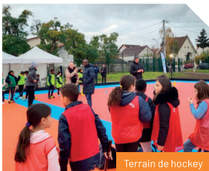
Terrain de hockey

✓ Nouveaux équipements : stade Alice-Coachman, gymnase Coubertin, halle sportive du 3 e collège, terrain Alice-Milliat, aires de work-out et city stades