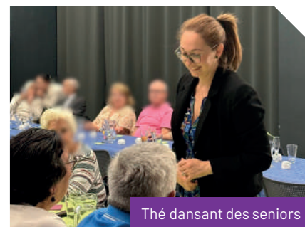
Thé dansant des seniors

✓ Organisation de différents événements (prévention des risques, thé dansant...)